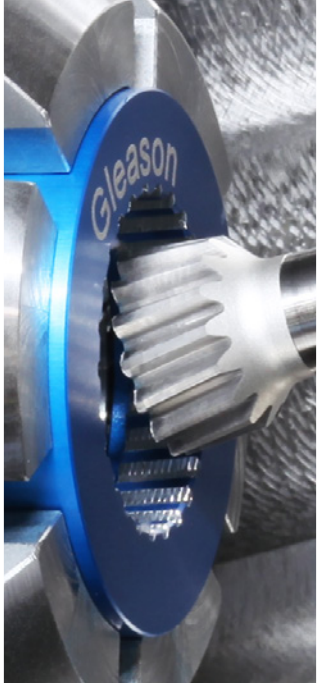
机器人零件的强力车齿加工