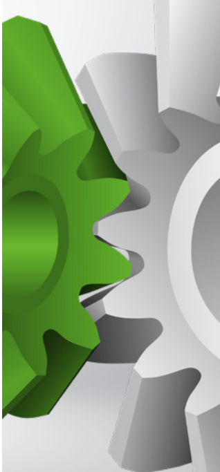
用于直齿锥齿轮的 Coniflex Pro